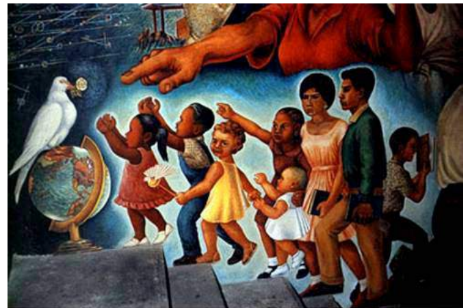
MURAL "PRESENCIA DEL MAESTRO EN LA HISTORIA DE MEXICO" (Fragmento), Auditorio 15 de Mayo, 3er. arco del muro izquierdo. (1960-1962)

Los educadores de este siglo se enfrentan ante una realidad mexicana en la cual es urgente la lucha por sus derechos fundamentales, como docentes y trabajadores, derechos que históricamente habían sido ganados a partir de procesos de resistencia y que hoy se encuentran en juego debido a las transformaciones económicas, políticas y culturales que se enfrentan en el país por la adaptación al capitalismo y globalización de corte neoliberal. Freire es muy claro en su obra Cartas a quien pretende enseñar, que los sujetos deberán