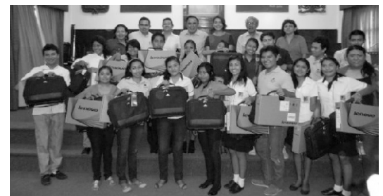
Entrega de Laptops a alumnos